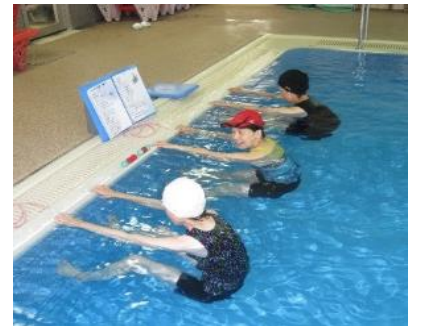
腰痛緩和のため、コーチと動きを確認しながらストレッチ