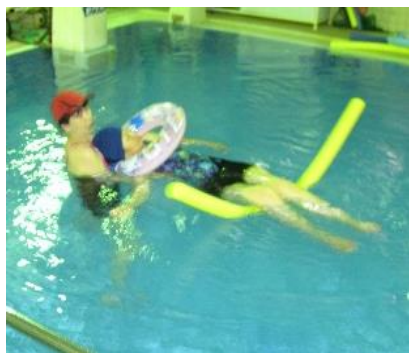
全身をストレッチで心地よいリラックス

50代 腰痛・肩こり緩和の為 リラックスできる穏やかな時間や運動量が私の体には丁度良くて、長く続ける事ができました。